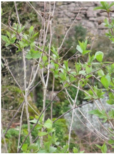
(Glacière – Dés 1258)