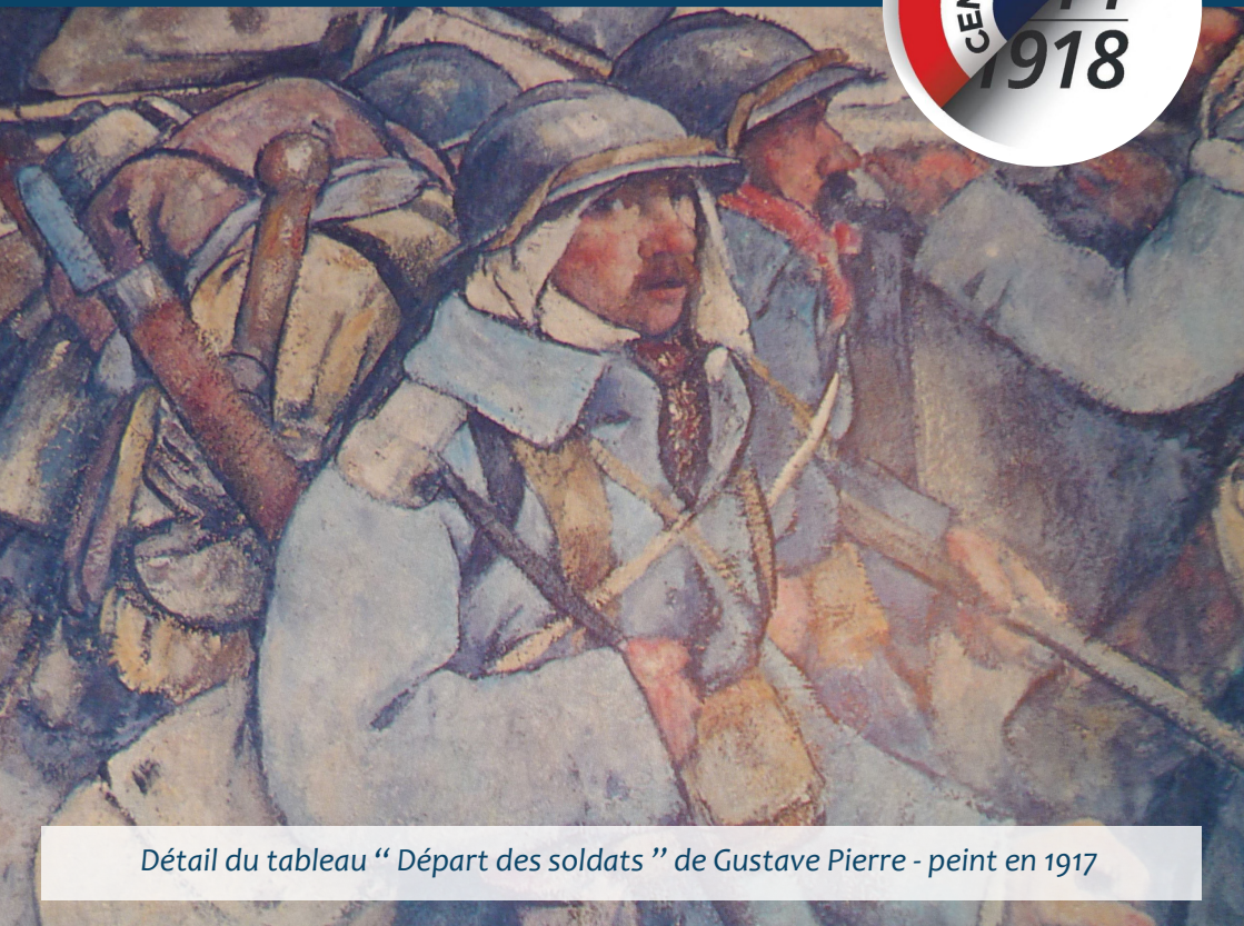
Détail du tableau "Départ des soldats" de Gustave Pierre - peint en 1917