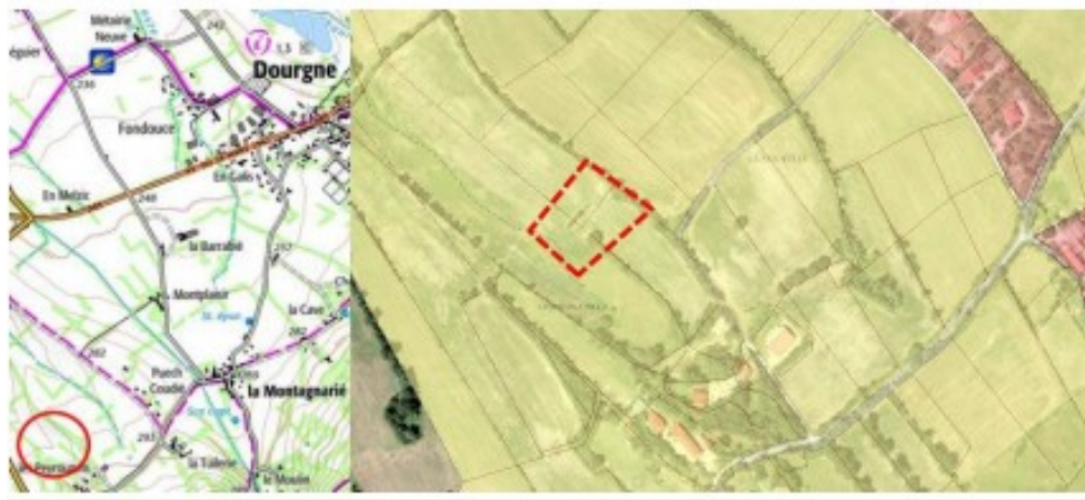
Présentation du projet de modification du PLUi sur le secteur « Les Peyrondels » à Dourgne

La notice d'évaluation environnementale (p.64 et ss) comporte une partie intitulée « Incidences du projet sur les sites Natura 2000 » et liste les évolutions du PLUi susceptibles d'impacter ces sites (par exemple, le STECAL du lieu-dit « Les Peyrondels » sur la commune de Dourgne, à 400 m du site Natura 2000 « Montagne noire occidentale »). La notice d'évaluation environnementale se contente d'indiquer à partir de données uniquement bibliographiques que les projets contenus dans la modification n'auront pas d'incidences sur les sites Natura 2000, sans le démontrer sur la base d'analyses terrain proportionnées aux enjeux desdites zones et aux projets envisagés.