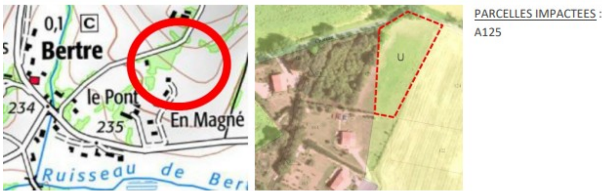
Présentation du projet de modification du PLUi sur le secteur « Le Pont » à Bertre,